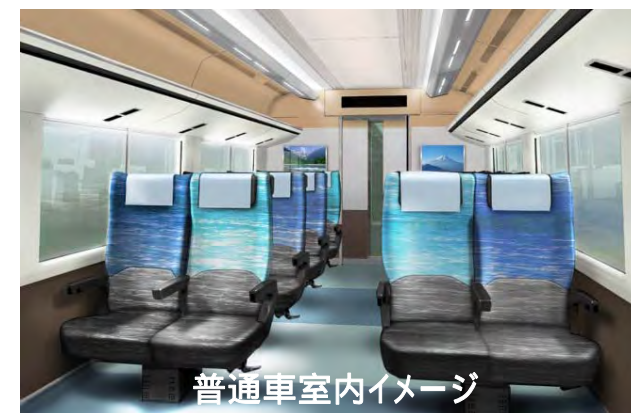
普通車室内イメージ