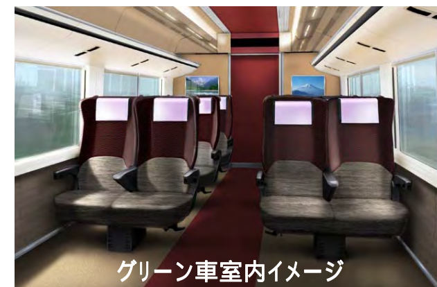
グリーン車室内イメージ