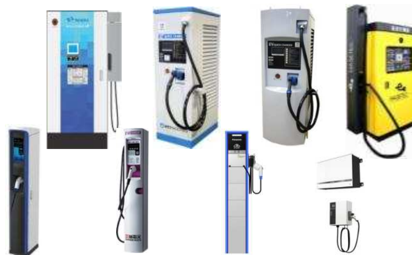
充電器メーカーとのビジネス連携