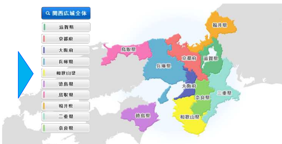
広域圏での充電インフラ連携・仕様共通化