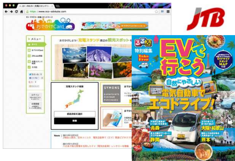
JTBグループとのビジネス連携