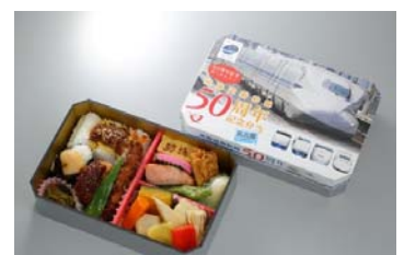
「東海道新幹線50周年記念弁当」