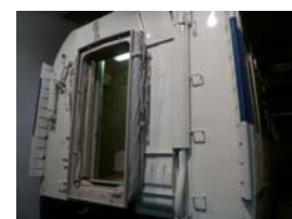
0系16形式新幹線電車