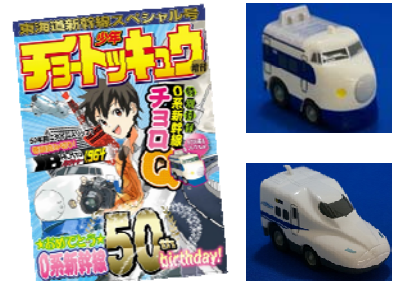
少年漫画誌風 チョロQ2両セット